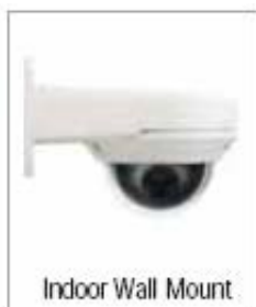
Indoor Wall Mount