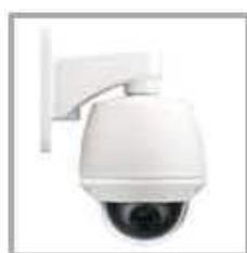
Outdoor Wall Mount